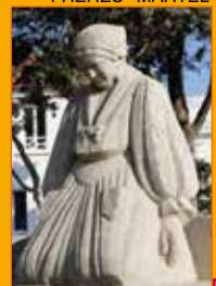
MONUMENT AUX MORTS DES FRÈRES MARTEL