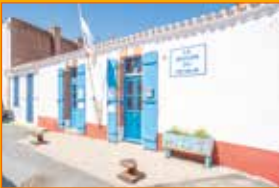
MAISON DU PÊCHEUR